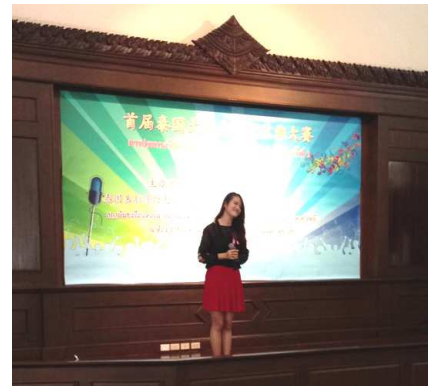
นิสิตทั้งสามคนโชว์น้ำเสียงและลีลาบนเวที