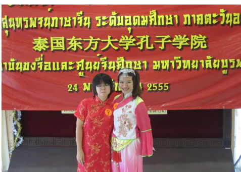
นิสิตที่คว้ารางวัลถ่ายภาพร่วมกัน

สถาบันขงจื่อแห่งมหาวิทยาลัยบูรพาและศูนย์จีนศึกษา มหาวิทยาลัยบูรพา ร่วมกันจัดการประกวดสุนทรพจน์ภาษาจีน ระดับอุดมศึกษา ภาคตะวันออก ครั้งที่ 3 ขึ้นเมื่อวันที่ 24 พฤศจิกายน 2555 ณ มหาวิทยาลัยบูรพา